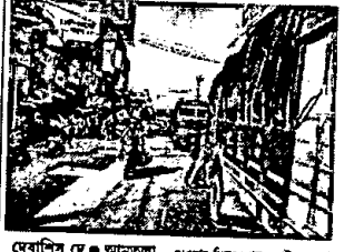
আমতলায় যানজটের প্রধান সমস্যা বেআইনি গাড়ি পার্কিং