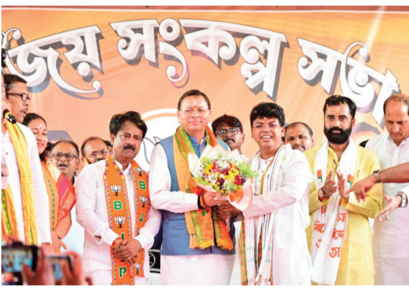
উত্তরাখণ্ডের মুখ্যমন্ত্রী সাংবাদিকদের মুখোমুখি হয়ে জানান, 'গঙ্গা গোমুখ থেকে উৎপত্তি হয়ে গঙ্গাসাগরে এসে সমুদ্রে মেশে। গঙ্গাসাগরের কিনারায় আজ জনসমূহ দেখলাম। একটা কথা স্পষ্ট পশ্চিমবঙ্গে পরিবর্তন আসছে